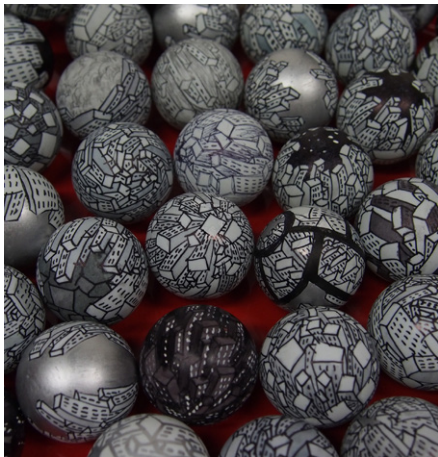
LUCA MATTI "Ultramondi"