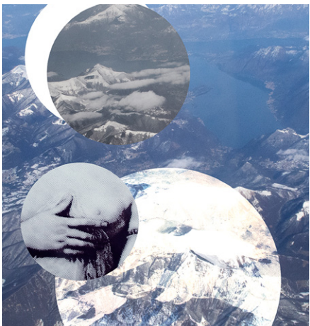
BÄRBEL REINHARD "_"

TOMOKO SUGAHARA è nata a Tokyo nel 1963. Laureata in pittura presso la Tokyo National University of Fine Arts and Music nel 1988, successivamente ha ottenuto un master in Belle Arti con specializzazione in pittura murale, affresco e mosaico, presso la stessa Università. Ha soggiornato a lungo in Italia, studiando presso L'Accademia di Belle Arti di Firenze. Attualmente collabora con varie Università giapponesi insegnando pittura e tecniche del mosaico.