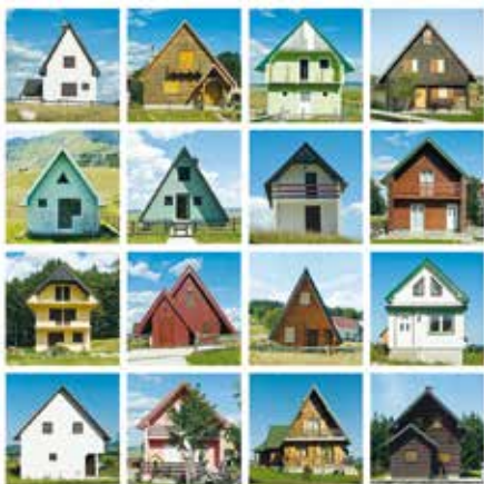
Francesco Niccolai "Montenegro, 16 ritratti", stampa digitale su alluminio, 2014 cm 30x30 (x16)