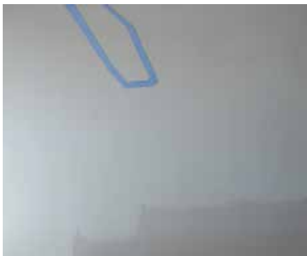
Stefano Loria Questo lo devi sapere olio su tela, 2014 cm 50 x 60