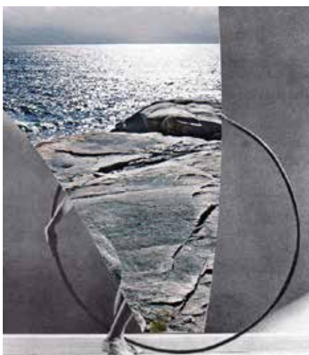
Beatrice Squitti S.T. collage 2015 24x14

SERGIO TOSSI: ha interpretato in modo personale molti dei ruoli fondamentali nel sistema dell'arte contemporanea. All'inizio della carriera con la sua "Domestic gallery" - una serie di mostre allestite nell'appartamento in cui allora abitava - ha introdotto a Firenze un modo fresco e disinvolto di accostarsi alle opere degli artisti. Più tardi, a partire dall'inizio degli anni Novanta, nelle ampie gallerie di Prato e Firenze (eleganti spazi industriali ristrutturati) ha indagato e proposto molta pittura italiana ed internazionale, figurativa ed astratta, senza trascurare altre forme di espressione artistica costruendo di fatto un vero e proprio percorso di ricerca all'interno del lavoro delle nuove generazioni. Dal 2009 al 2011 è stato direttore del Centro per l'arte contemporanea EX3 di Firenze. Dal 2012 opera come curatore indipendente. Scrive di arte e basket sul quotidiano La Repubblica.